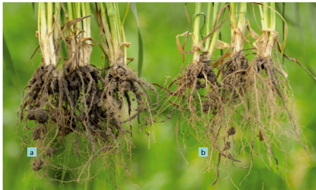
On the top: a Winter weed with Ruter AA. b Control.