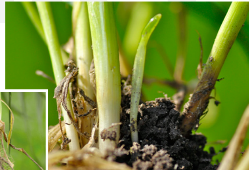
Improving stems development and their number.

Efektiivse koostisega, tõhus toode, Leedus kasutusel alates 2002. aastast: